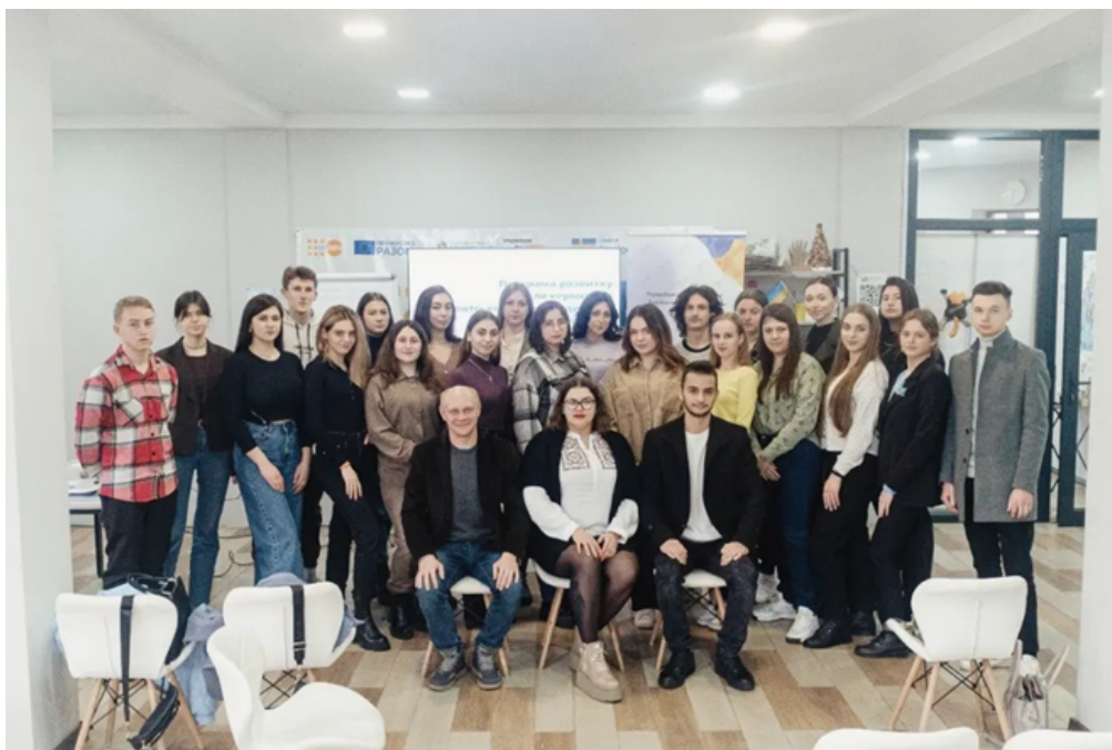
Студентська рада, відділ навчально-виховної роботи

Під кінець кожного дня – рефлексія. Поговорили про усі висвітленні теми, семінари, практики. Поділилися своїми емоціями з учасниками та організаторами заходу. У висновку: свої напрацьовані проекти разом із командами. Далі – більше!